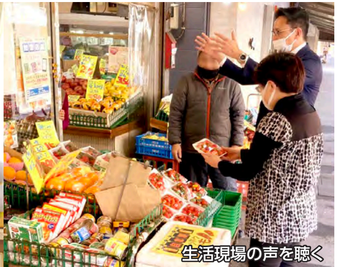
生活現場の声を聴く