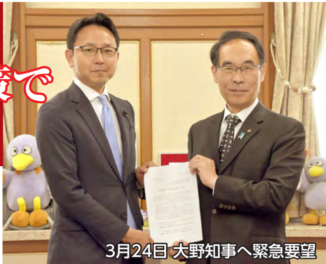
3月24日 大野知事へ緊急要望