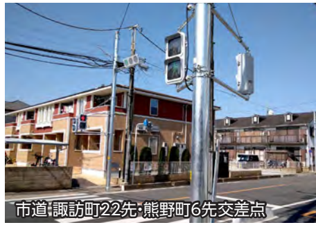
市道諏訪町22先・熊野町6先交差点