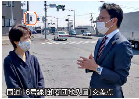
国道16号線[卸商団地入口]交差点