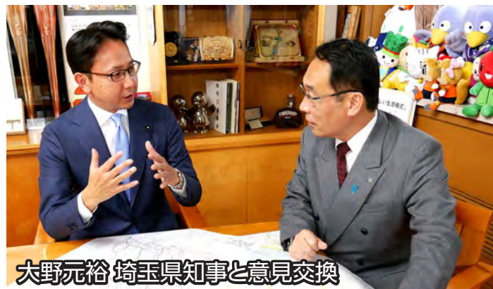
大野元裕 埼玉県知事と意見交換