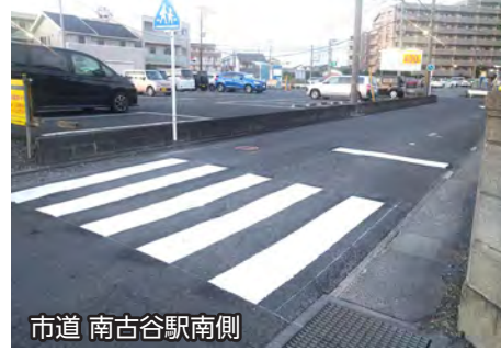
市道 南古谷駅南側