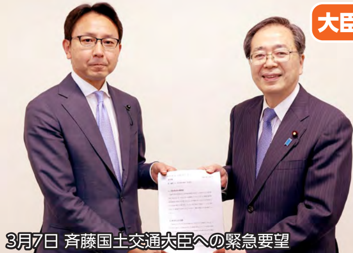
3月7日 齊藤国土交通大臣への緊急要望