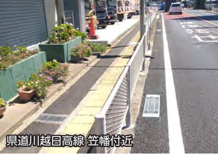
県道川越目高線 笠幡付近