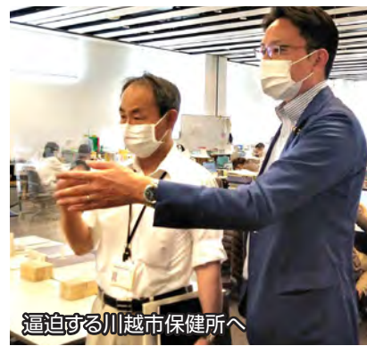
逼迫する川越市保健所へ