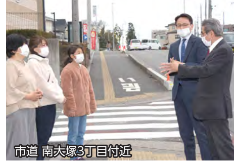
市道 南大塚3丁目付近