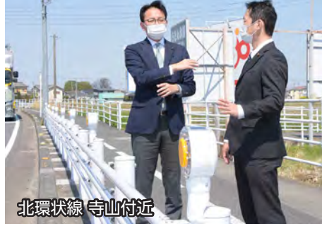
北環状線 寺山付近