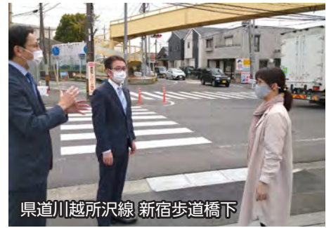
県道川越所沢線 新宿歩道橋下