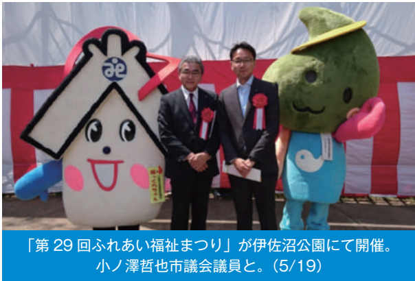
「第 29 回ふれあい福祉まつり」が伊佐沼公園にて開催。小ノ澤哲也市議会議員と。(5/19)