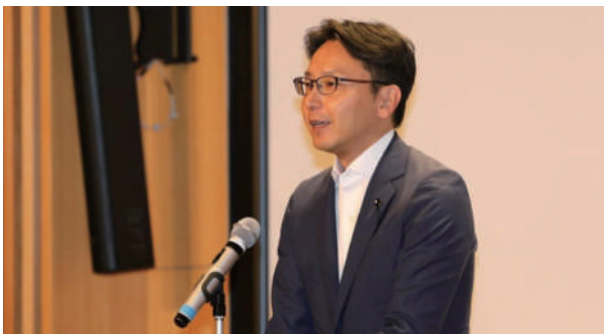
公明党川越支部大会にて県政報告する深谷県議 (7/3)